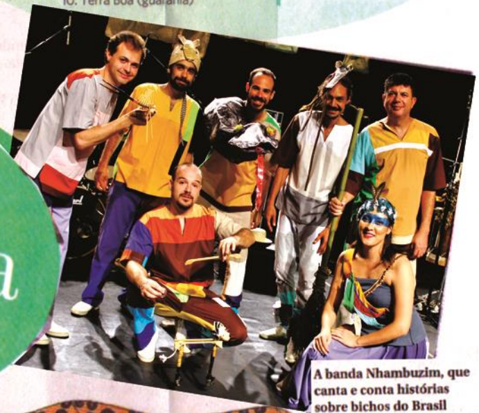
A banda Nhambuzim, que canta e conta histórias sobre bichos do Brasil

Bichos de Cá CD: Distribuidora Tratore, R$ 25,00 Livro: Bamboo Editorial, 52 págs., R$ 88,00 (com aplicativo)